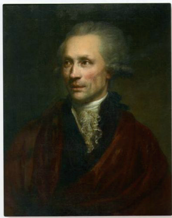
БАРОН АНДРЕЙ ЛЬВОВИЧ ФОН НИКОЛАИ Людвиг Генрих Николаи 1737 - 1820