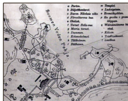
План 1905 г.