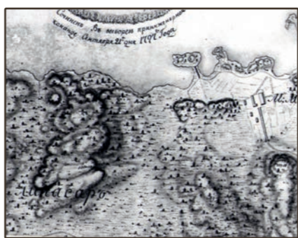
План 1797 г.