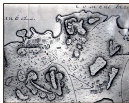
План 1802 г. Фрагмент.