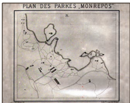
У. Э. Моден. План 1875 г.