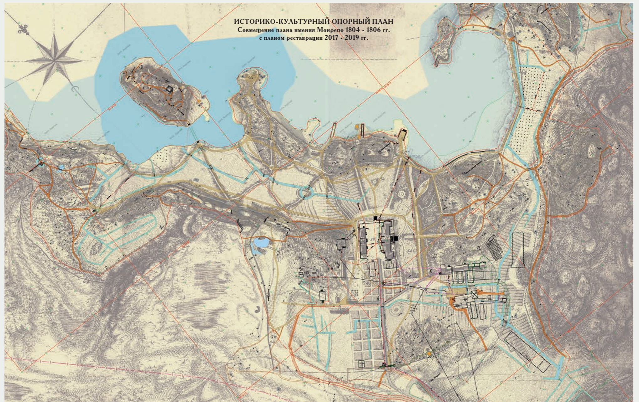
ИСТОРИКО-КУЛЬТУРНЫЙ ОПОРНЫЙ ПЛАН Совмещение плана имения Монрепо 1804 - 1806 гг. с планом реставрации 2017 - 2019 гг.